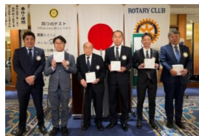
えらられる誕生日を迎える会員各位

先週の週報(2026年6月4日発行・No.2317号)の「ロータリーを知りましょう会」報告原稿において、ロータリーの標語に関する記述に誤りがございました。ここに謹んで訂正し、お詫び申し上げます。当初の原稿では、2大標語である「超我の奉仕」と「最もよく奉仕する者、最も多く報いられる」の両方をアーサー・シェルドン氏が提唱したかのように掲載してしまいました。正しい歴史的事実としましては、「最もよく奉仕する者、最も多く報いられる」はアーサー・シェルドン氏が提唱されました。一方、「超我の奉仕」の成り立ちとしましては、1911年大会でその原型(無私の奉仕)が誕生し、1950年のデトロイト国際大会で公式標語として承認されました。その後、1989年の規定審議会にて、こちらが「第一標語」として明確に位置づけられました。先日の夏元会長の講演内におきましては、上記の内容通りに正しくご講義いただいていたにもかかわらず、こちらの不手際で誤った報告を掲載してしまいました。夏元会長をはじめ、会員の皆様に誤解を招く表現となりましたことを深くお詫び申し上げます。今後ともどうぞよろしくお願いいたします。 文責：三島敏宏