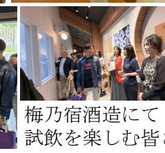
梅乃宿酒造にて試飲を楽しむ皆さん