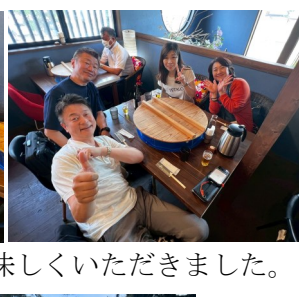
流しそうめん～美味しくいただきました。