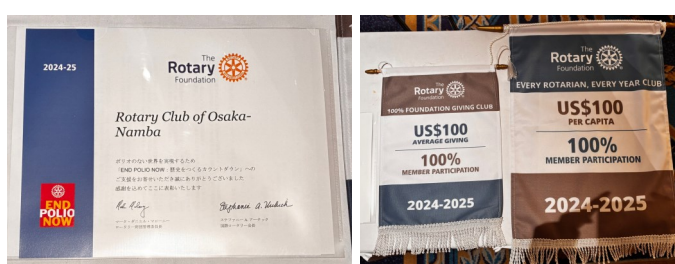
地区大会での昨年度の表彰