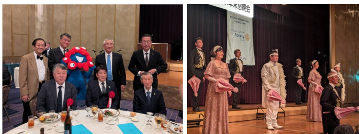
立花会長、清水幹事が大阪南R Cの年末懇親会に出席されました。