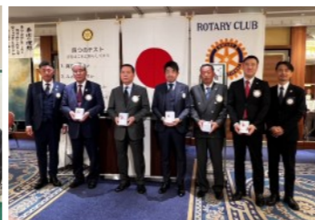
本日お誕生日を迎えられる会員各位