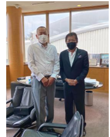
川井会員が川口会長を訪問されました。